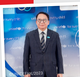
政務司司長陳國基先生在致辭中肯定UNICEF多年來的工作。

活動由政務司司長陳國基先生及行政會議非官守議員召集人葉劉淑儀議員擔任主禮嘉賓，並邀請到滬江維多利亞學校及曹欣怡小朋友為我們獻上動人心弦的表演。聯合國兒童基金會地區（東亞及太平洋）大使楊千嬅女士、UNICEF HK大使郭晶晶女士及黃金寶先生，以及劉秀樺小姐藉此機會分享他們過往的倡議和探訪活動，以不同的方式幫助弱勢社群。