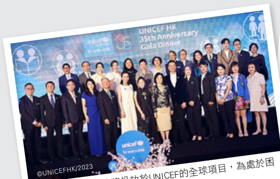
晚宴所籌得的善款將投放於UNICEF的全球項目，為處於困境中的孩子帶來改變。