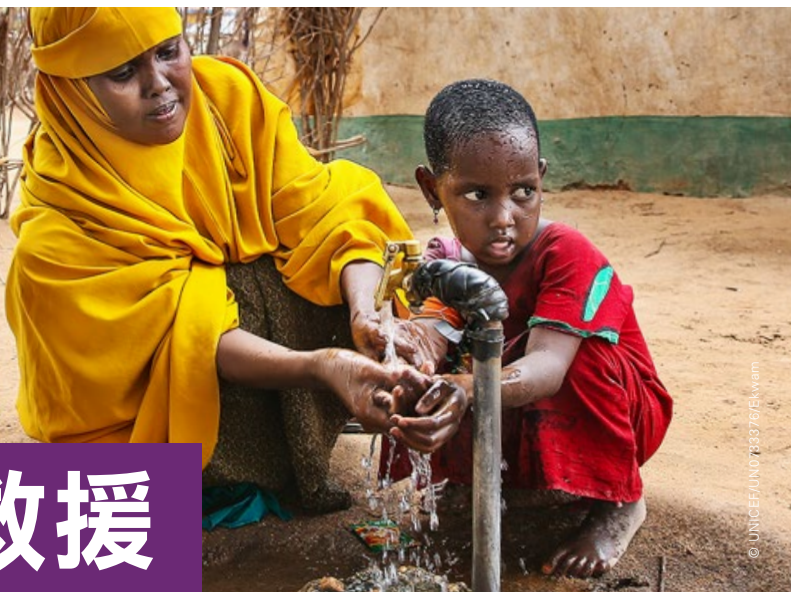
UNICEF協助興建太陽能供水設備，為災民提供寶貴地下水源。

UNICEF與合作夥伴於2022年度為由埃塞俄比亞、肯雅、索馬里、厄立特里亞、吉布提、蘇丹和烏干達組成的「非洲之角」提供緊急人道救援，主要成果包括：