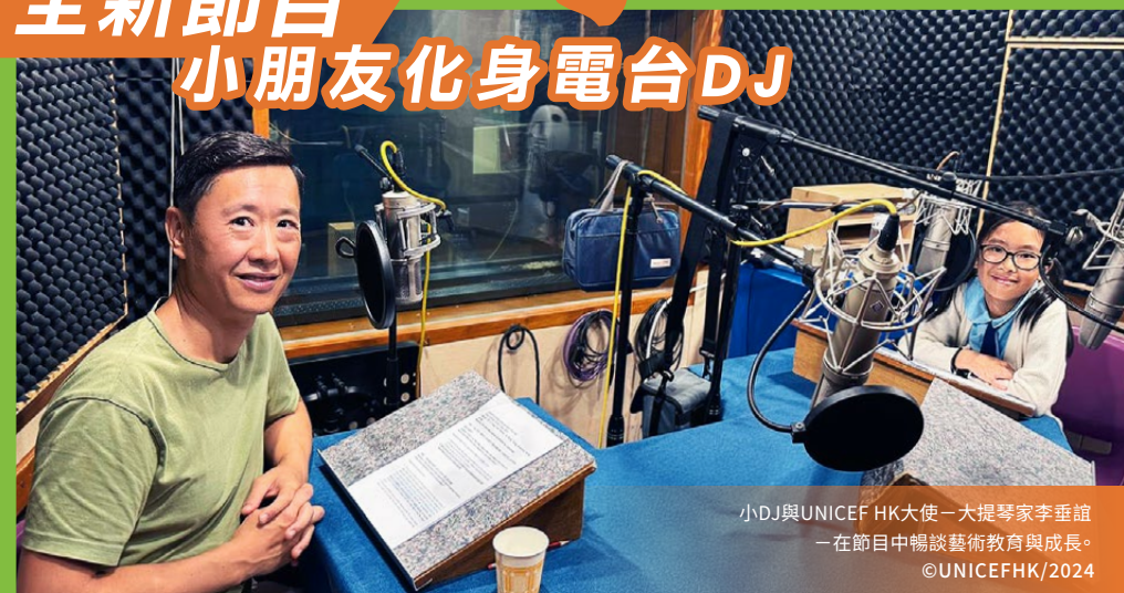
小DJ與UNICEF HK大使—大提琴家李垂誼 — 在節目中暢談藝術教育與成長。