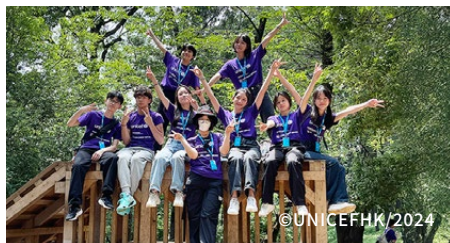
羽根木公園兒童友好設計，令一眾青年使者樂而忘返。

以第一身感受過兒童友好城市的活力與美好，青年使者帶著所見所聞回港，希望推動香港成為兒童友好城市一員，為孩子們打造一個充滿童趣的環境！