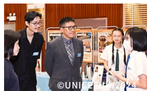
獲獎同學向一眾嘉賓介紹於計劃中的學習經歷與成果。

來自127間學校的同學，合共完成近10,000個SDGs課程及行動，包括以生果發泡膠網包裝雞蛋、善用果皮製茶、咖啡渣製作磨砂護理用品等，達至不同可持續發展目標。超過85%受訪同學認同，計劃有助提升他們在日常生活中實踐可持續發展目標的意願。