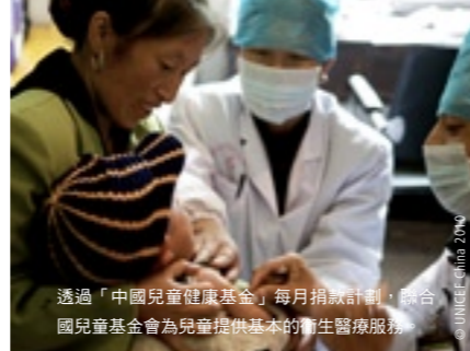
透過「中國兒童健康基金」每月捐款計劃，聯合國兒童基金會為兒童提供基本的衛生醫療服務。