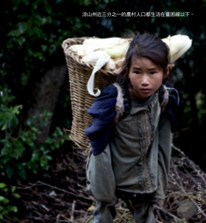
涼山州近三分之一的農村人口都生活在貧困綫以下。