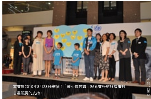
本會於2010年8月23日舉辦了「愛心傳甘肅」記者會答謝各機構對甘肅賑災的支持。

聯合國兒童基金會香港委員會於2010年舉辦了連串活動為甘肅泥石流災禍及巴基斯坦水災賑災工作籌款，至今兩項工作分別已籌得逾港幣400萬元及170萬元。兩地災難先後在去年夏季發生，聯合國兒童基金會均即時啟動救援工作，包括：為甘肅災民提供母嬰健康及護理設備、疫苗冷庫設備、淨水丸等，以及在災後每日為超過290萬名巴基斯坦災民提供清潔食水、衣物、棉被及教學物資予當地兒童等，幫助兩地災民盡快重過正常生活。