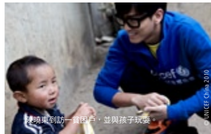
陳曉東到訪一貧困戶，並與孩子玩耍。